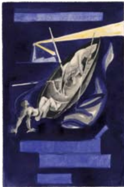
К. М. Зданевич. Эскиз обложки. ПУБЛИКУЕТСЯ В ПЕРВЫЕ

И это могло бы быть рецептом длительного успеха, если бы ему следовали хладнокровно и не портили его идеей об англосаксах как об избранном народе. Так, министр финансов в администрации Полка заявлял, что, несмотря на любые препоны, в конце концов «превосходство нашей англо-кельтско-саксонско-норманской расы приведет народы к великой конфедерации, которая в конечном итоге охватит всю Землю». Но даже тогда, как утверждает Мид в главе «Протоколы гринвичских мудрецов», несмотря на наличие неких узнаваемых общих принципов, ни о каком четком генеральном плане не могло быть и речи.