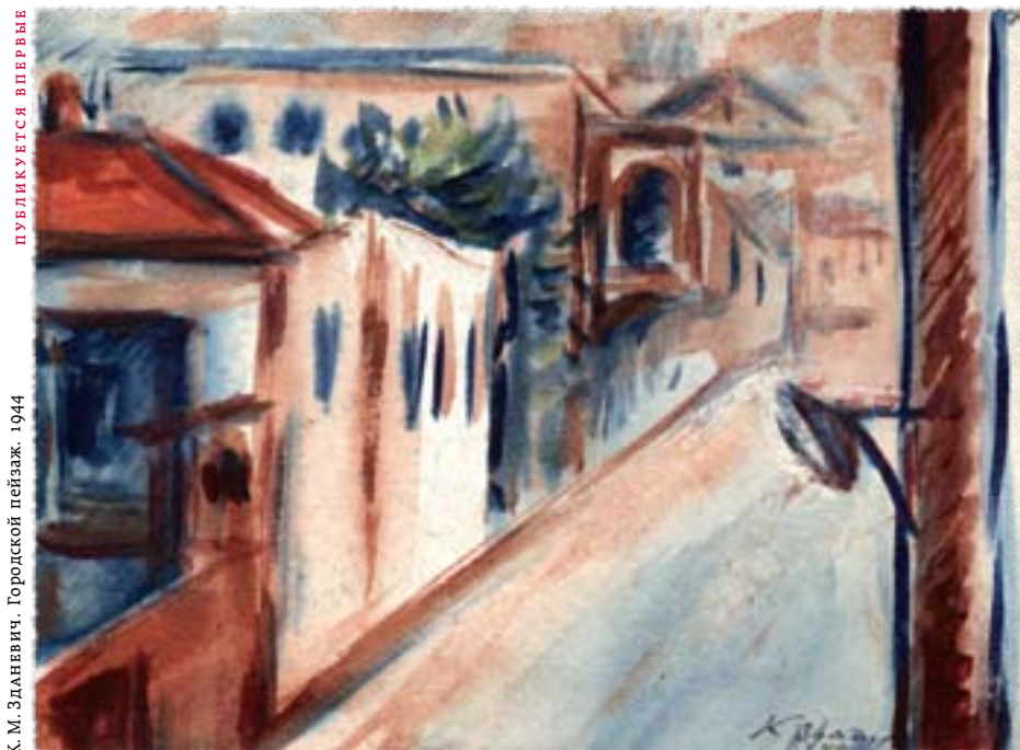
К. М. ЗДАНЕВИЧ. Городской пейзаж. 1944

единенных Штатах, евангелистские протестанты, обладает «весом и способностью для создания важного нового массового общественного мнения, отвечающего идеалам Нибура». По мере того как это движение набирало все большие обороты на протяжении последних десятилетий, из его рядов выдвинулись более зрелые и ответственные ин-